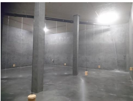
Dreischichtverputz mit Kathodenschutzanlage (nachher)