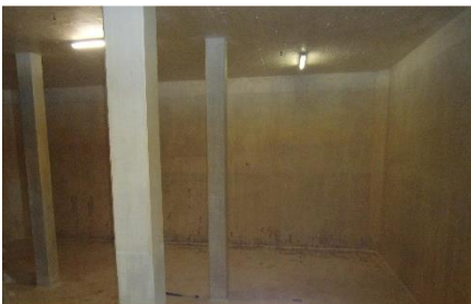
1.1 Beschichtung ersetzen mit dreischichtigem Verputz (Wände, Boden) Aufgeweichte Kammerbeschichtung (vorher)

Die Reservoirkammern wurden mit einer Kathodenschutzanlage ausgerüstet, um die Korrosionsschäden zu verhindern. Die Beschichtung wurde als Dreischichtverputz ausgeführt.