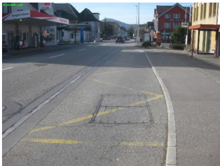
Ausgangslage Richtung Leuggern

Die Bauarbeiten wurden im Ortszentrum von Kleindöttingen unter Verkehr ausgeführt, welcher während der Arbeitszeit mit Lichtsignalanlagen geregelt wurde und am Abend wieder mit reduzierter Durchfahrtsbreite offen war. In Fahrtrichtung Leuggern musste die Zufahrt zum Parkplatz und zur Baustelle des Neubaus des Hochbaus andauernd offen gehalten werden. Mit der Bauausführung kam hinzu, dass der Deckbelag zwischen den beiden Haltestellen ebenfalls ersetzt wurde.