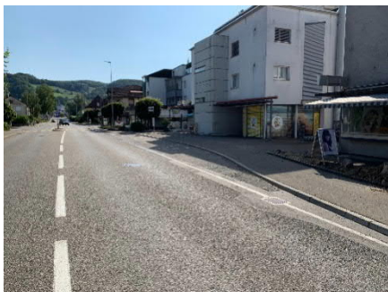
Ausgangslage Richtung Döttingen