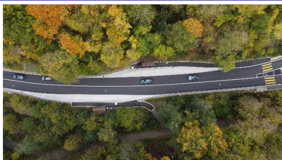
Haltestellen Abzweigung Asp

Insbesondere die Zu- und Wegfahrt im Bereich des Volg-Ladens kombiniert mit einer auf dem selben Areal liegenden Transportfirma stellte spezielle Anforderungen an die Planung und später auch an die Realisierung. Ausserdem wurde der Knoten, an den der Ortsteil Asp angeschlossen ist, neu mit einer sogenannten Linse gelöst. Die fünf Haltebuchten wurden, dem BehiG entsprechend, geplant und realisiert. Der hohe Lastwagenanteil der Staffeleggstrecke stellte bezüglich Sicherheit höhere Anforderungen. Die Realisierung erfolgte in zwei Gruppen. Die beiden Lichtsignalanlagen wurden über einen Master abgeglichen. Diese Massnahme trug wesentlich zu einem guten Verkehrsfluss bei.