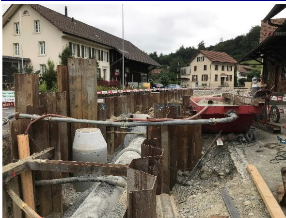
Spundwände im Dorfkern

Aufgrund der Tatsache, dass die Abwasserleitungen teilweise im Grundwasser erstellt werden mussten, waren umfangreiche Abklärungen betreffend die Bauweise zu treffen. Ab dem tiefsten Punkt der neu zu erstellenden Kanalisationsleitung wurde das Microtunnelingverfahren angewendet. Das Grundwasser im Startschacht wurde mittels Wellpointensystem abgesenkt. Die konventionellen Gräben im Dorfkern mussten aufgrund der Baugrund- und Grundwasserverhältnisse mit Spundwänden gespiesst werden.