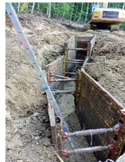
Freilegung der Quelle