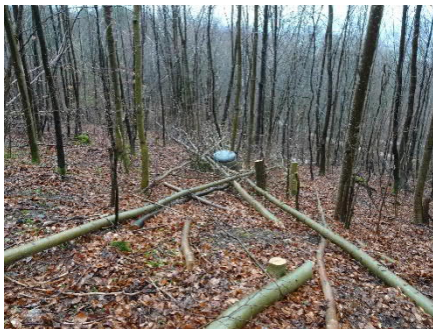
Kontrollschacht vor Sanierung

Zur Fassung einer allfälligen weiteren Quelle wurde eine Fertigbrunnenstube unterhalb der Fassung vorgesehen. Die Bauarbeiten wurden komplett im Wald ausgeführt. Dabei musste der bestehenden Leitung gefolgt werden, bis die Quelle gefunden wurde. Die Neufassung wurde an die bestehenden Leitungen angeschlossen.