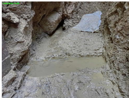
Felskluft der Quelle