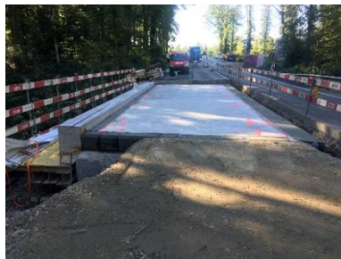
Neue Brückenplatte B-7408