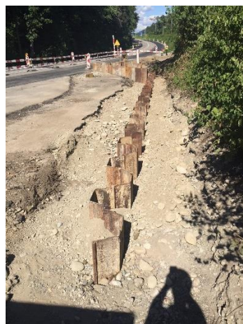
Spundwandriegel (Böschungsstabilität SBB-Damm)