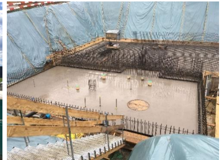
Bodenplatte des Schieberhauses