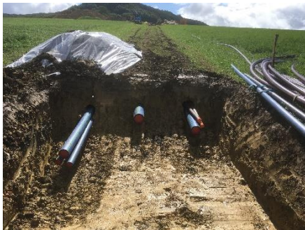
Werkleitungsbau im Pflugverfahren