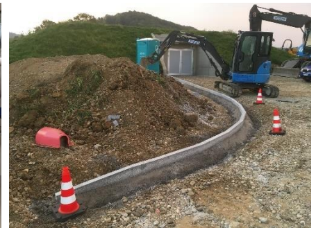
Umgebungsarbeiten Reservoir Egg