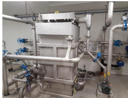
Ultrafiltrationsanlage während dem Bau