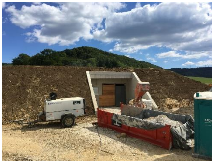
Blick auf Eingangsbereich im Bau