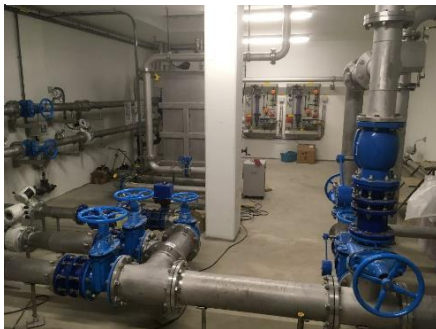
Rohrkeller des Reservoirs vor Plattenleger