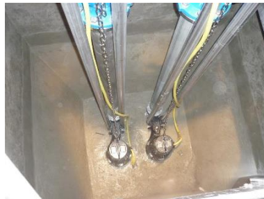
Sanierter Pumpensumpf mit installierten Abwasserpumpen, Druckrohre und Armaturen