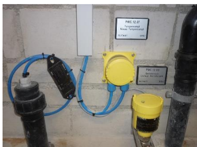
Messeinrichtungen für Niveau und Hochalarm