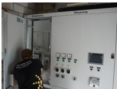
Einrichtung neue Steuerung im Betriebsraum