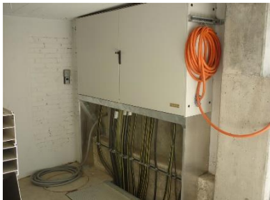
Neu versetzte EW Verteilkabine, links mit mobilen Dammbalken als Hochwasserschutz

Vorgängig der Bauarbeiten musste die provisorisch untergebrachte Verteilkabine der EW Mellingen ausserhalb der Pumpenanlage versetzt und an neuer Stelle mittels mobilen Dammbalken gegen Hochwasser geschützt werden.