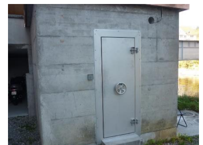
Aussenansicht Pumpwerk mit Hochwasser-Drucktüre