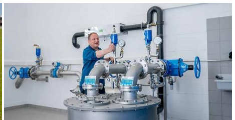
Abnahme des erstellten Bauwerks durch Bauleiter