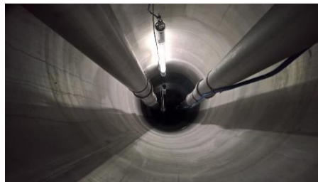
Installation der hydraulischen Elemente in der Fassung