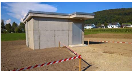
Rohbau der Grundwasserfassung