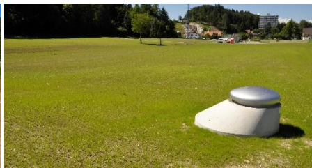
Ansicht Schluckbrunnen, im Hintergrund Pumpwerk im Bau