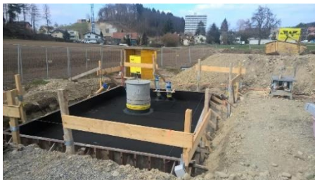
Einbau der Bodenplatte

Das Wasser aus der alten Grundwasserfassung Fislisbach wird über eine neu erstellte Leitung und einem neu erstellten Anreicherungsbrunnen ins Grundwassergebiet des neuen Grundwasser-Pumpwerkes eingespeist. Ziel dieser Einspeisung ist es, die Wasserergiebigkeit aus dem neuen Grundwasserpumpwerk zu verbessern bzw. zu erhöhen.