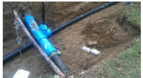
Anschluss des Pumpwerks an das bestehende Verteilnetz