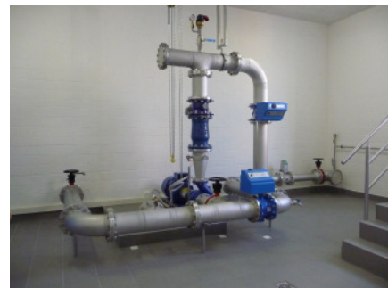
Hydraulische Anlage mit ferngesteuerten Pumpen, Schiebern und Klappen