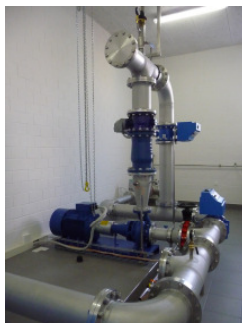
Hochdruckpumpe und Klappen