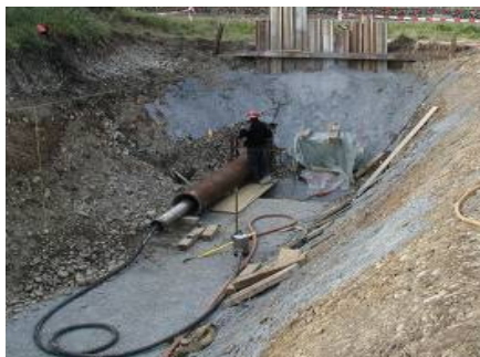
Baugrube für Stahlrohr-Durchschlag

Die Zuleitungen (Wasser und Elektrokabel) unterqueren die Kantonsstrasse und die SBB-Linie Suhr-Oberentfelden. Um den Strassen- und Schienenverkehr nicht zu beeinträchtigen, wurden alle Leitungen in zwei grabungslos durchgeschlagenen Stahl-Schutzrohren (d=500mm) eingezogen. Die Zuleitung der Wasserversorgung wurde im Laufe mehrerer Jahre in Etappen bei Strassenausbauten mit einer Nennweite von 300mm erstellt.