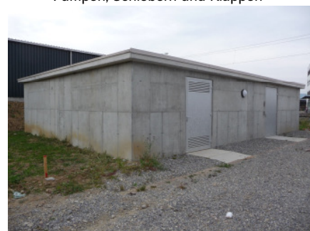
Trafostation und Stufenpumpwerk