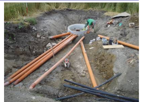
Überläufe, Abläufe, Drainagen