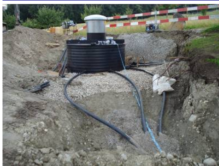
Sammelbrunnstube 1 versetzt

Die Quellfassungen im Gebiet Bergmatten liefern jährlich etwa 150'000 m 3 Trinkwasser. Allerdings waren die Fassungen teilweise in einem schlechten Zustand und die bestehenden 11 Brunnstuben vermochten den heutigen Ansprüchen der Lebensmittelhygiene nicht mehr zu genügen. Das Projekt forderte das Zusammenfassen der 11 Brunnstuben zu 3 Sammelbrunnstuben. Ausserdem wurden einige Fassungen erneuert sowie die Schutzzonen nach Fertigstellung der Bauarbeiten ausgeschieden.