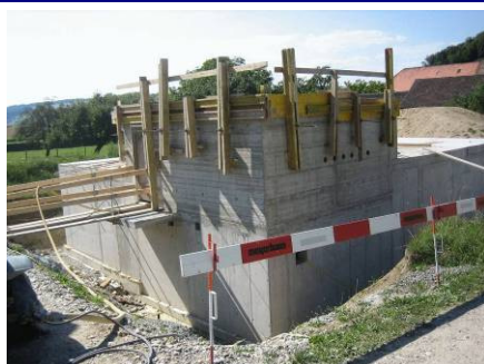
Quellwasserpumpwerk Haslach im Bau