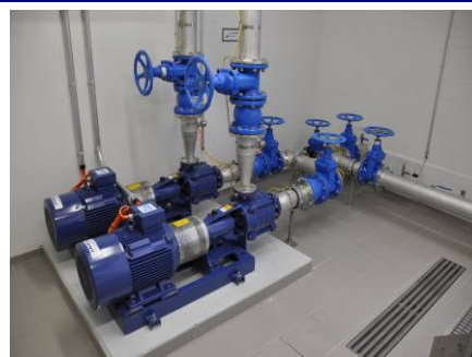
Quellwasserpumpen im Werk Haslach