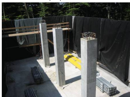
Reservoir Schinderwase im Bau