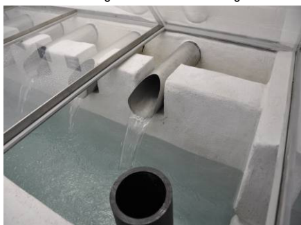
Sammelbrunnstube im Quellwasserpumpwerk