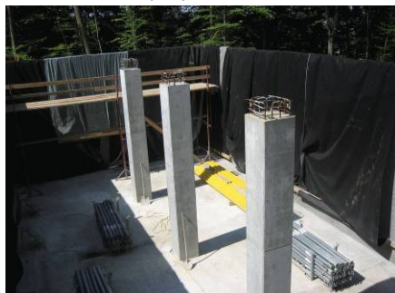
Reservoir Schinderwase im Bau