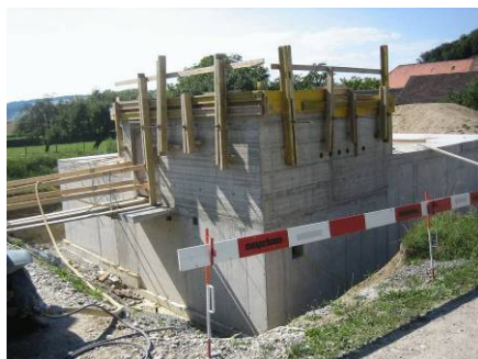
Quellwasserpumpwerk Haslach im Bau